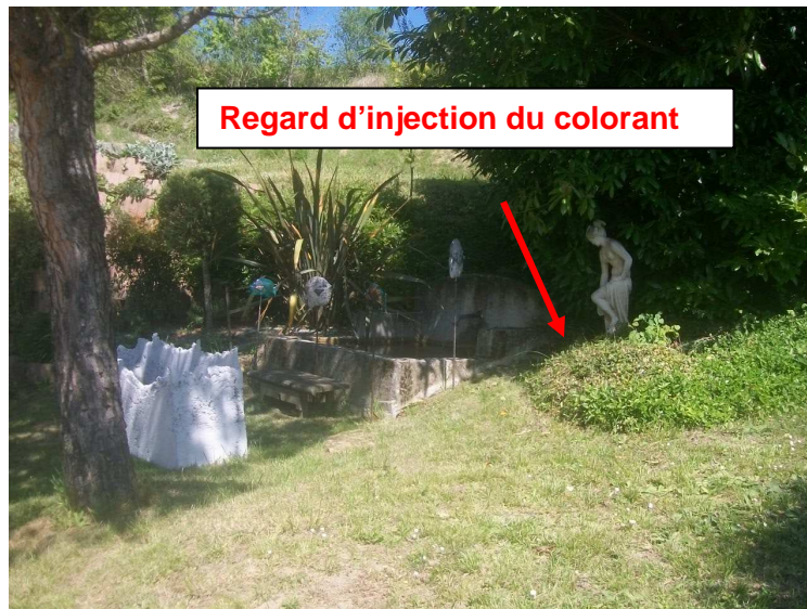
Bassin privé impasse des Roches